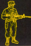
アーミーマシンガン