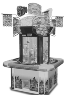
箱絵巻まんぷくすいぞくかん