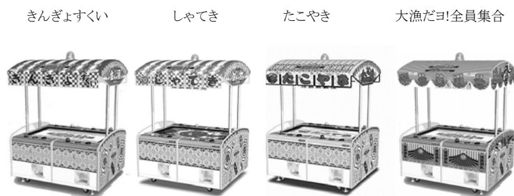
キッズ屋台村4P筐体