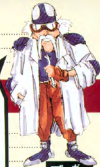
ガンスターズの助っ人 ブラウン博士