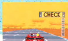
▲チェックポイント

残りタイムが0になるまでに、各ステージのチェックポイントを通過しないと、ゲームオーバーになり、それまでに走ったコースがマップで示されます。